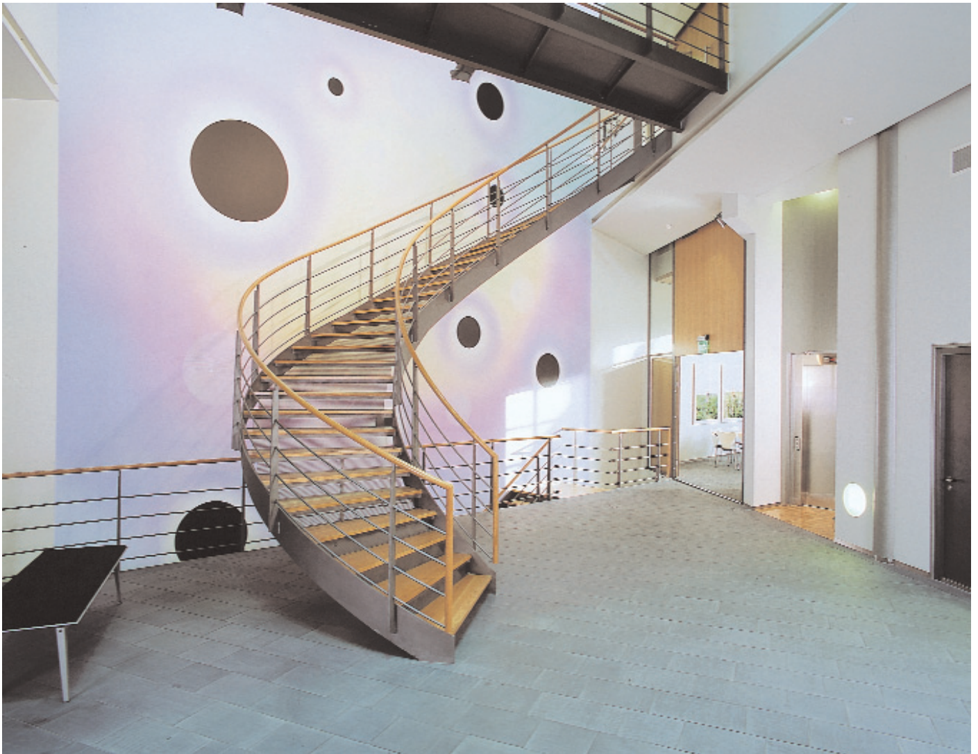
Roland Schimmel, 'Doors of Perception' 1350 x 945 cm, locatie: Nederlandse Ambassade Kiev, Oekraïne, 2001

ook op het zwart als de plek waar de geest geen grip op krijgt en waar het oog dood op loopt. Alle activiteiten spelen zich af langs de randen van de zwarte vorm.